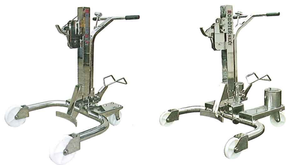
RX-1-SUS オールステンレス スタンダード型