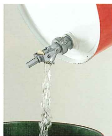
(写真はアルミダイカスト製)