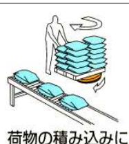
荷物の積み込みに