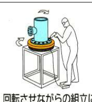
回転させながらの組立に